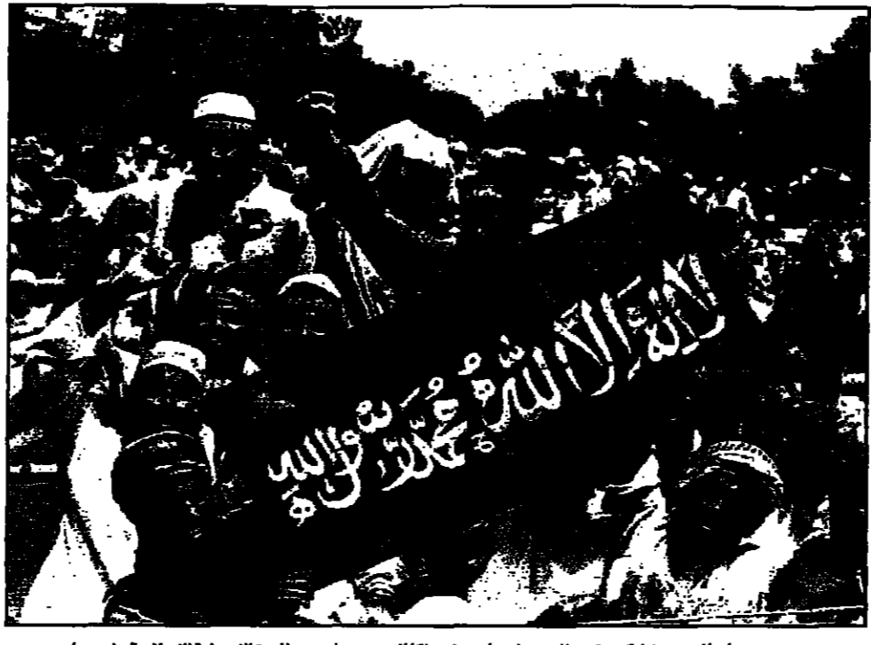
متمسكون إسلاميون يشاركون في طمأنينة نعش لاس في باكستان للتبليغ بمرضى طاعنة الاصلية الإسلامية

كابول - في بديات المعارضة الافغانية منذ الخسيس توليه مسؤوليات باخية كبيرة في الوقت الذي نجحت فيه في استعادة السيطرة العسكرية في مواجهة حركة طالبان الاسلامية المسلحة في كابول. فقد قتل الجنرال رئيس الوزراء في حادث تحطم طائرة في باميان في وسط البلاد، وهو من قادة المعارضة في قوات التحالف غفور رشادي الذي عين الاسبوع الماضي في هذا المنصب بسبب قدرته على التفاوض بين حركات الاكثلية المعارضة لطالبان التي غلبت ما عداها من الاقليات. وفي الوقت ذاته نشبت معارك بين قوات اوزبكية متنافسة في صفوف الفصائل الرئيسية المعارضة في مزار الشريف معاصمة الاكثلية في شمال البلاد. ويجسد هذا الحادثان اللذان وصلتهما ناطق باسم الائتلاف بانها معركة في الوقت الذي استعادت فيه قوات التحالف المعارضة للثورة العسكرية في الشمال من العاصمة الافغانية كابول. وقالت مصادر مطلعة ان محاولة فتح أسلحة من عناصر في الجيش اوزبكي ادت الى نشوب حرب شوارع في مزار الشريف لكن بعض هذه المصادر اشار الى ان المعارك توقفت منذ اسابيع اول. وتعتبر القوات اوزبكية الافضل تسليحا واكثر عددا في صفوف الاكثلية لكنها لا تشارك حاليا في المعارك التي يجرها المتطابقون للثورة لثلاث مسعود في الشمال من كابول، وكان قادة هذه القوات اكبر اول ايام اتم سبوتنكو على العاصمة في غضون اسابيع قليلة. وقد ادى سؤال بهذا الخصوص قال ناطق باسم مسعود الجمعة ان مقاتل غفور رشادي يقاتل جيش الشرف في صفوف الحلفاء العسكريين، وأضاف يقول ان الشكك في ذلك حاليا في غياب أي إمكانية لاستقبال رئيس الحكومة.